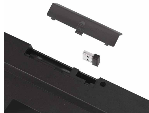
USB-Empfänger praktisch auf der Rückseite verstaut

Wenn die Tastatur nicht benutzt wird, schaltet sie in den Ruhemodus. Drücken Sie eine beliebige Taste, um sie aufzuwecken.