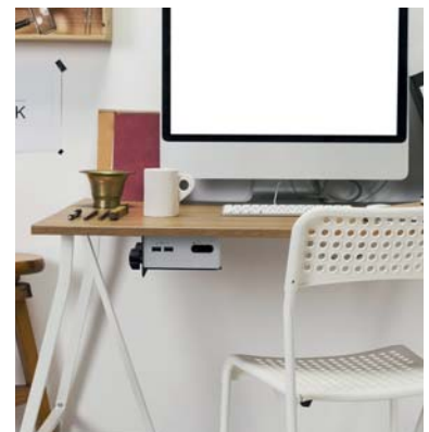
Kann unter dem Schreibtisch befestigt werden